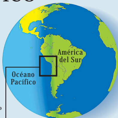
Lugar del conflicto (1879-1883)

La guerra del Pacífico se produjo en el Desierto de Atacama, entre los años 1879 y 1883. En esta guerra participaron los países de Perú, Bolivia y Chile. En ese entonces -1879-, la frontera de Chile llegaba hasta Tarapacá, por lo cual Antofagasta formaba parte del territorio boliviano. Más al norte, Arica e Iquique eran parte del Perú. A pesar de todo esto, la riqueza salitrera que cubría el suelo antofagastino era explotada por capitales extranjeros, fundamentalmente chilenos. Esto fue la principal causa de la guerra.