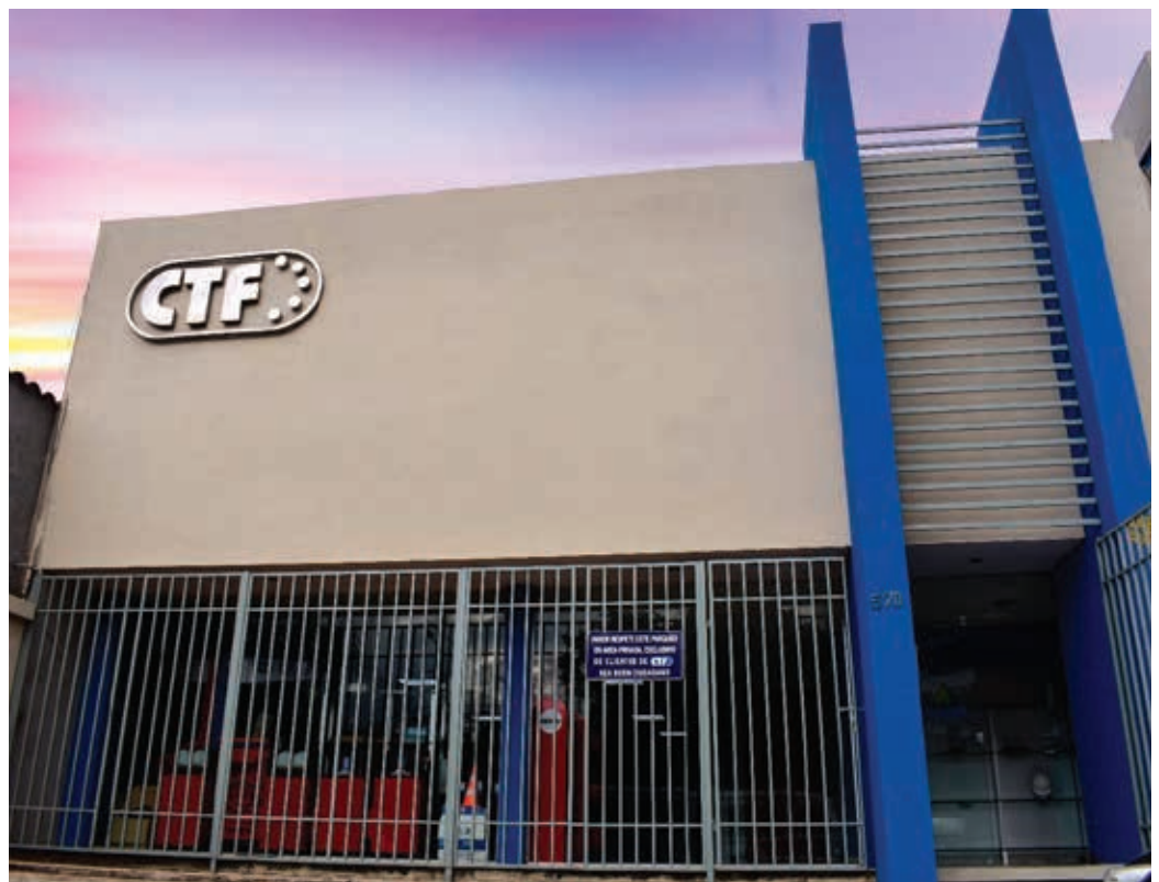
Prestigio. La empresa cuenta con marcas de primer nivel en filtros y lubricantes.

Lubricantes Mitsu. Se trata de la única marca japonesa en el país, con un envase premium infalsificable, diseñado específicamente para motores japoneses.