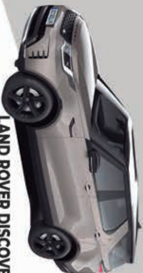
LAND ROVER DISCOVERY