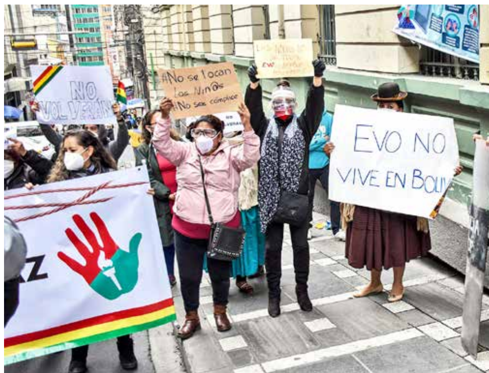
Protesta de plataformas ciudadanas, en la audiencia del caso Evo Morales, ayer.

ticia falla en contra de Morales, el MAS aceptará esa decisión y seguirá con la campaña electoral para el 18 de octubre.