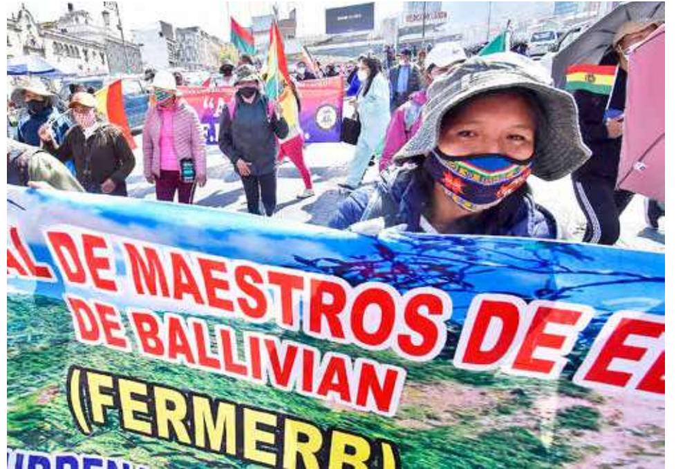
Protesta de maestros contra el cierre del año escolar.