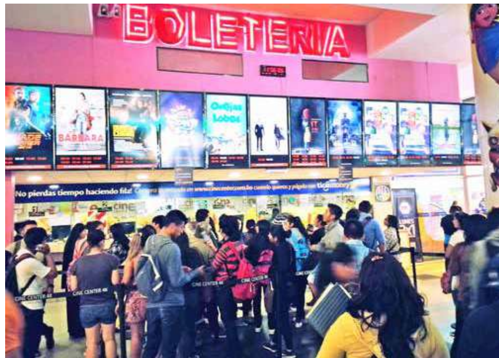
Prime Cinema. Personas viendo la cartelera de un cine local.

De momento, las salas de cine no ofrecerán muchos estrenos por la situación de la pandemia y de la industria de cine en el mundo.