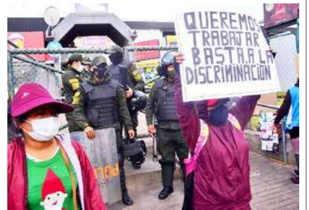
Protestas en la Terminal de Buses. JOSÉ ROCHA