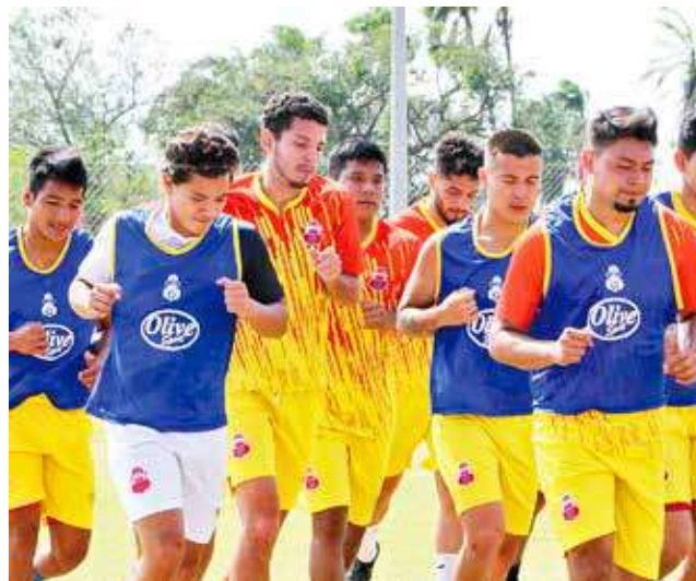
Práctica del cuadro de Guabirá, ayer.

nificación durará toda la semana y si es que el cuerpo médico lo dispone desde el próximo lunes se trabajará con todo el grupo, en un solo horario, para aprovechar el tiempo y llegar en óptimas condiciones al Apertura.