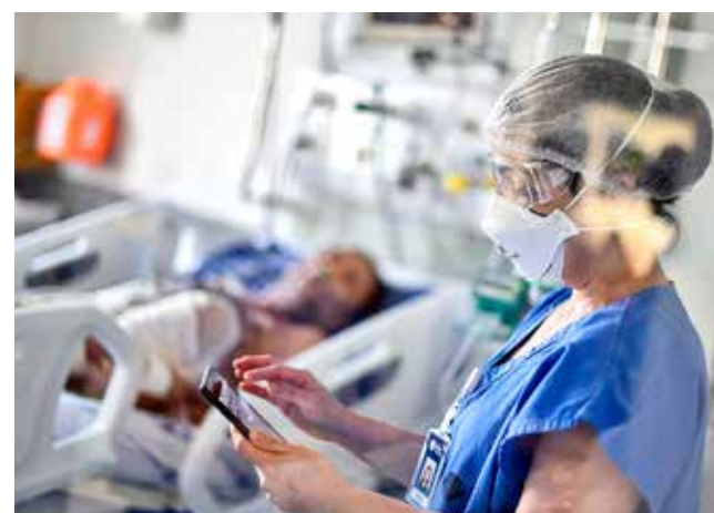
Ensayo de la vacuna se llevará a cabo en Brasil.

Paralelamente, el Gobierno regional de Sao Paulo, el estado más rico y poblado de Brasil con 46 millones de habitantes, cerró una aso-