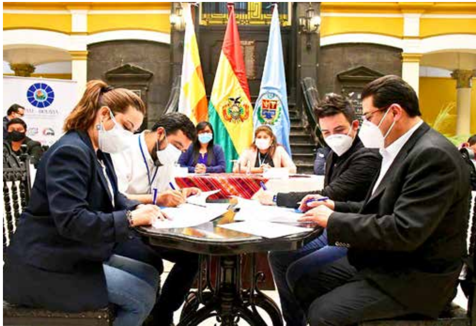
Firma del convenio entre Sigma y la FAM, ayer en la Gobernación. CARLOS LÓPEZ

La FAM-Bolivia debe concentrar la demanda de los gobiernos municipales para la compra del Avifavir.