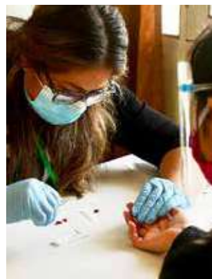
La prueba para detectar el coronavirus. CARLOS LÓPEZ

La Federación de Entidades Empresariales Privadas de Cochabamba (FEPC), a través de la plataforma “Cochabamba Sin Virus”, impulsa el uso de vitamina D para fortalecer el sistema inmunológico para prevenir la propagación de la Covid-19 y reducir el índice de mortalidad de 7,6 por ciento con el propósito de acelerar la reactivación económica.