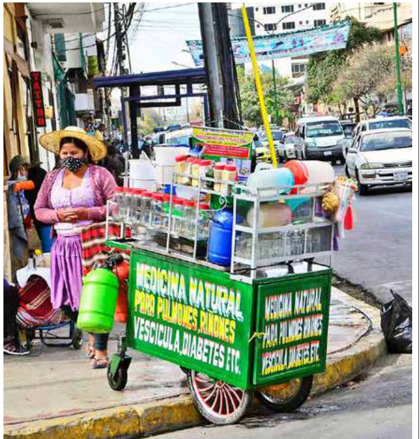
MEDICINA NATURAL. Este puesto de remedios naturales es uno de los más concurridos por la gente, en la Ayacucho y Gral. Achá.

ENVÍE SU FOTO PARA PUBLICARLA EN ESTA SECCIÓN A: fotografia@lostiempos-bolivia.com