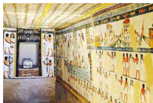
Espacio. El interior de uno de sus museos.

El pasado 1 de julio, las famosas pirámides de Guiza y varios recintos y sitios arqueológicos de Egipto, como