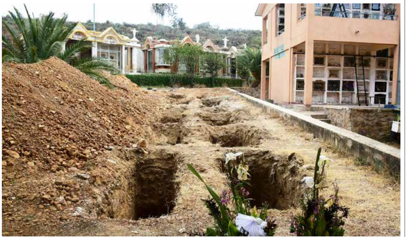
La preparación de fosas para entierros de Covid-19 durante la época crítica de decesos por la pandemia. CARLOS LÓPEZ

En el posconfinamiento se debe vigilar la cantidad de decesos, porque muchos se automedican.