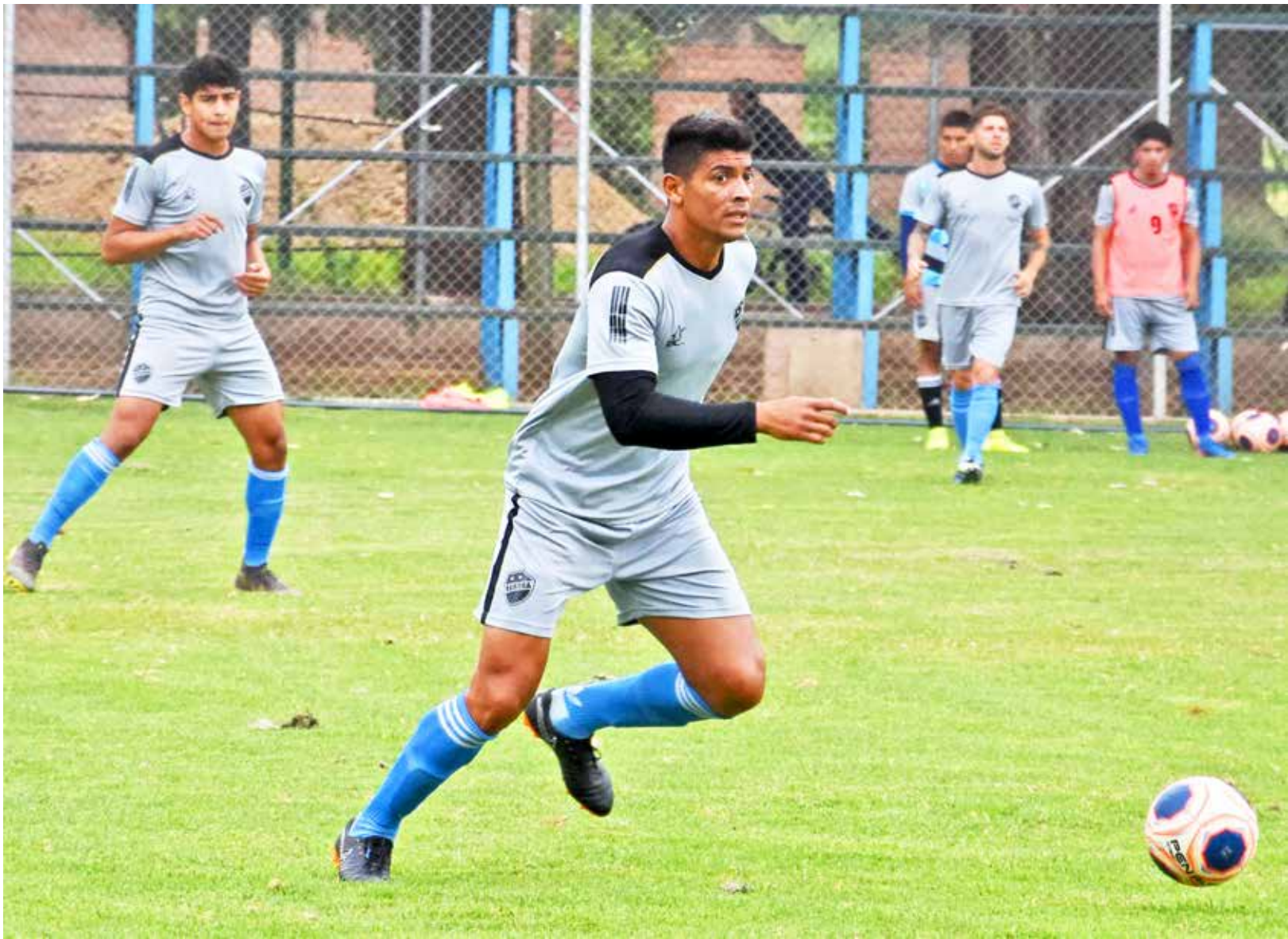
Jugadores del club Aurora se entrenan en su complejo deportivo antes de la cuarentena. AXXXX