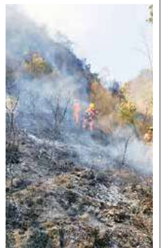
Uno de los incendios que afectó al Tunari.

Romero indicó que el Parque Nacional Tunari es el que mayor afectación presenta, debido a que registra 4.600 hectáreas de vegetación quemada y mencionó que por eso se implementa un plan de prevención como patrulla-