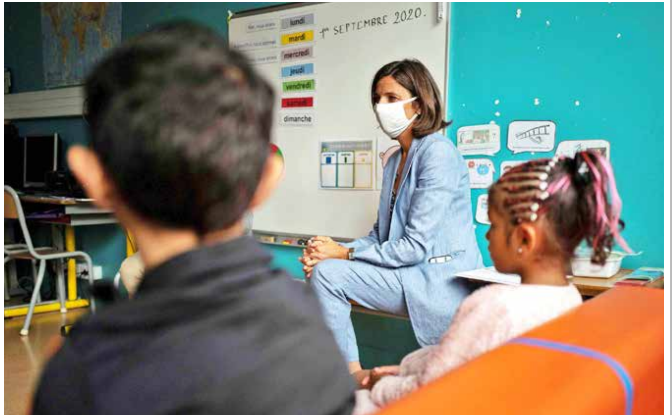
Autoridades educativas visitan la escuela primaria Francoise Heritier, en Toulouse.

Israel inició su vuelta al cole en medio de una segunda ola sin controlar y un preocupante récord el lunes desde el inicio de la pandemia, con los alumnos sujetos a estricta higiene, aulas en parques y teatros y grupos separados.