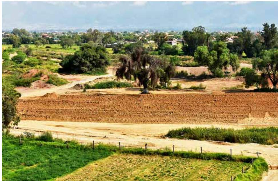
La construcción de una terminal privada en una zona de vocación agrícola.