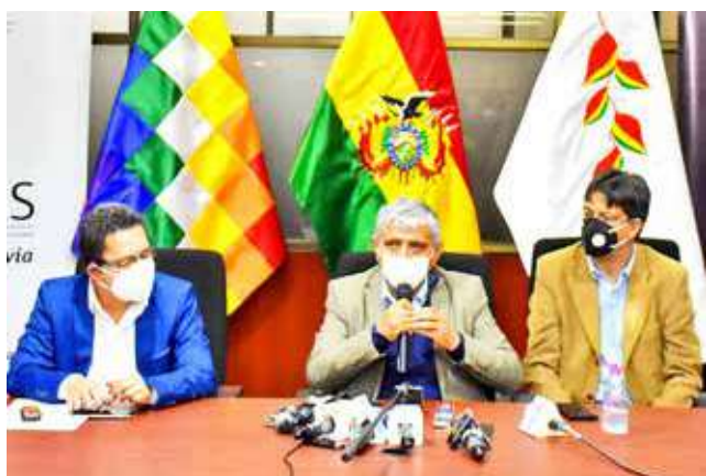
Conferencia del Ministerio de Obras Públicas y Entel. APG

Red. El Gobierno promete una mayor velocidad, mientras que el precio para el usuario será anunciado el viernes