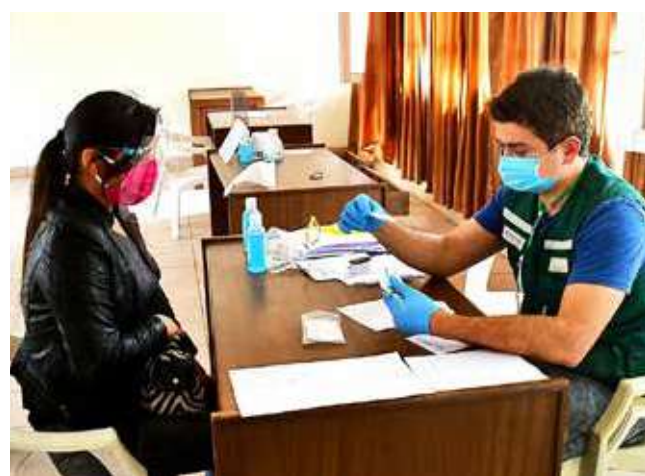
El trabajo de “Ángeles contra el Covid-19”. CARLOS LÓPEZ

La cantidad diaria de pacientes, en el pico en julio, llegó a 120. Ahora atienden entre 30 a 40 al día.