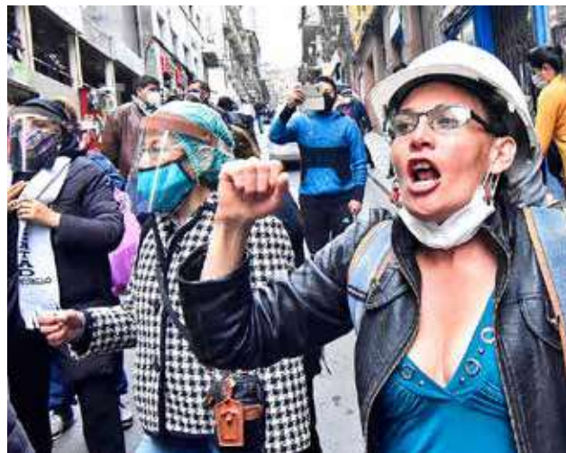
Vigilia de colectivos pide la inhabilitación de Evo Morales.

En ese sentido, sostuvo que "el pueblo boliviano tiene los ojos en estos jueces y en caso de que intenten, por esta vía, tratar de habilitar a Morales, nosotros nos reservamos el derecho de asumir las medidas procesales penales en contra de ellos". El candidato de Comunidad Ciudadana, Carlos Mesa, también se refirió al caso y dijo que si es necesario se iniciarán acciones legales si es que se habilita a Morales y aseveró que no hay ningún argumento legal para que se autorice esa postulación.