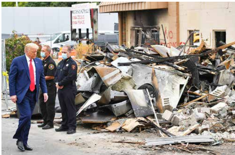
El presidente Donald Trump recorre un área afectada por disturbios en Kenosha.

Deja, una mujer que presenció el tiroteo, solo dio su nombre, declaró que gritó "no le disparen, no le disparen", mientras los agentes intentaban detener a Kizzee, quien vivía en su vecindario.