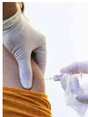
Un voluntario recibe la vacuna de prueba.

El ministro japonés de Salud, Trabajo y Bienestar, Katsumobu Kato, confió en que