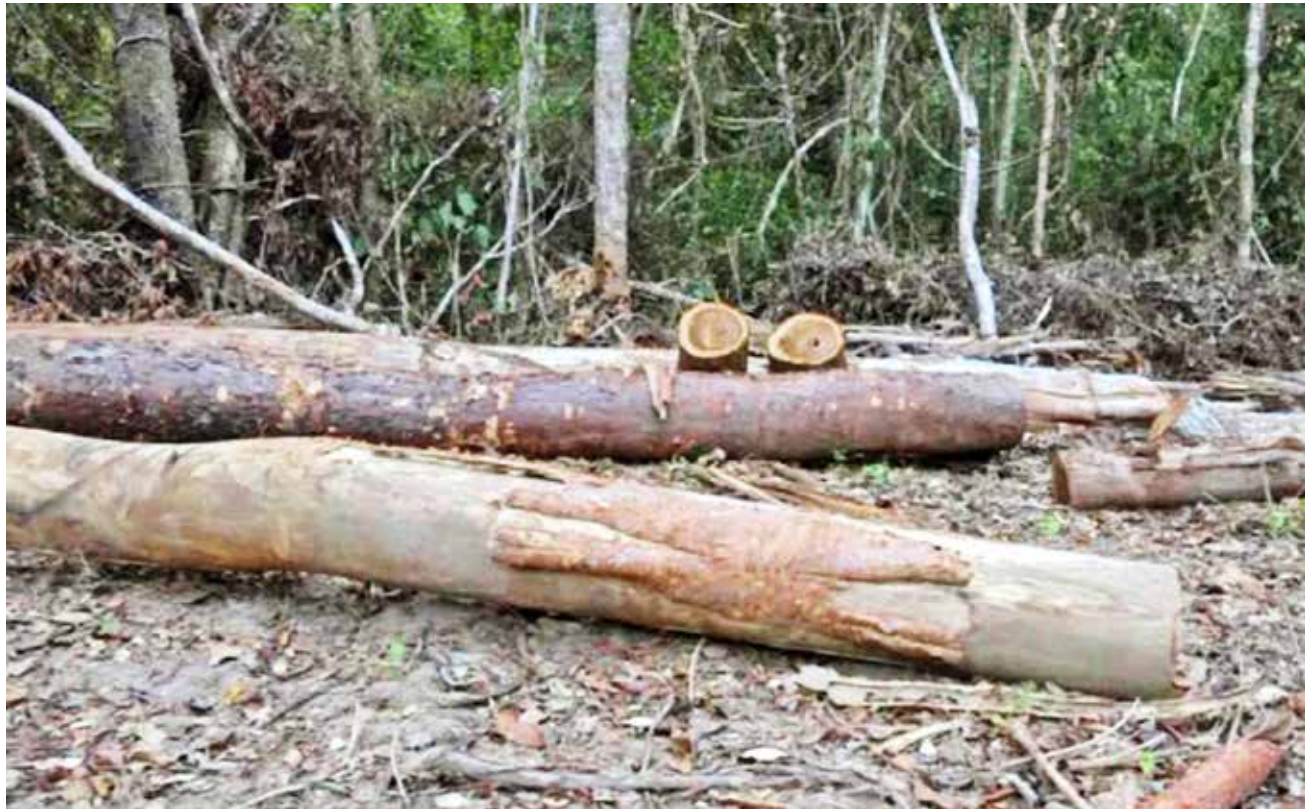
Desmontes presuntamente ilegales en San Ignacio de Velasco, Santa Cruz.

Otro habitante del lugar reclamó por la prohibición de quema hacia “los humildes”,