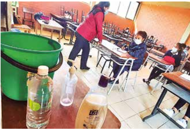
Estudiantes en clases con medidas de bioseguridad. D. JAMES

Modalidad. El porcentaje restante que aún no pasa clases en aula está en la Red de Cercado 1, en la zona norte de la ciudad