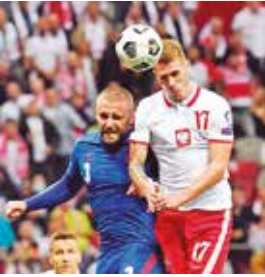
Partido Polonia vs. Inglaterra, ayer.