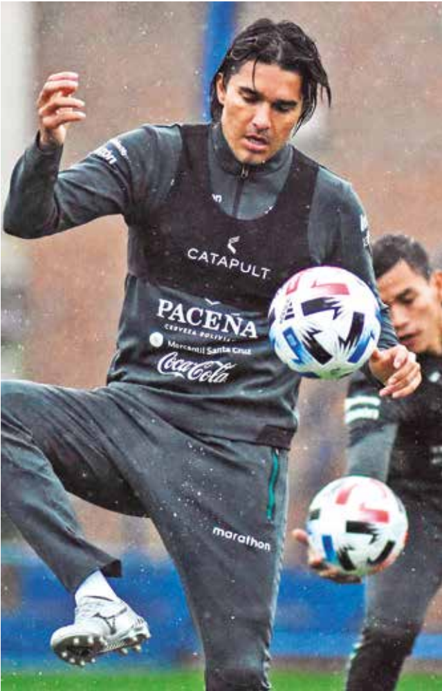
Entrenamiento de la selección nacional, en la previa del duelo ante Argentina.

“Será un partido difícil, no nos preparamos para per-