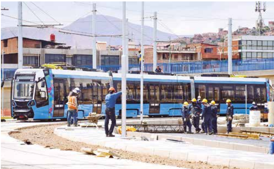
El desplazamiento de los vagones del tren metropolitano en la estación. CARLOS LOPEZ