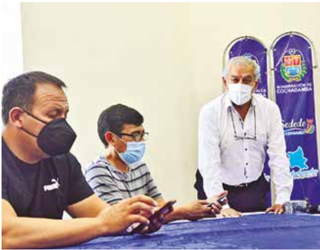
Los miembros de la FBF en la reunión. HERNÁN ANDIA

Pese a que parte de su directorio no quiso que deje de lado su postura, finalmente, Arce decidió acceder al reconocimiento del otro bando y pidió garantías porque existen sanciones pendientes por la división. “Nos toca la parte del reconocimiento. No es de mi agrado ni de la dirigencia, pero sólo interesa Cochabamba”, afirmó.