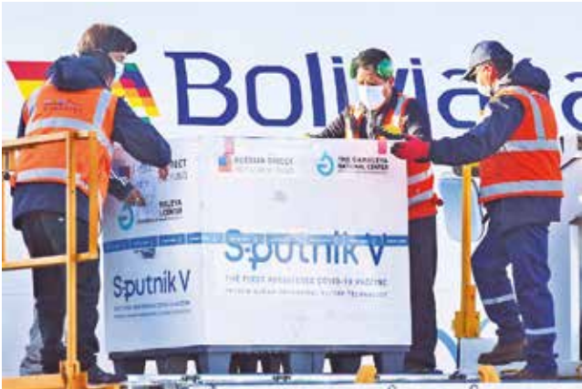
Arribo de vacunas Sputnik a la ciudad de La Paz.

Trámites. Según el Gobierno se están realizando todas las gestiones para garantizar el arribo del inmunizante ruso