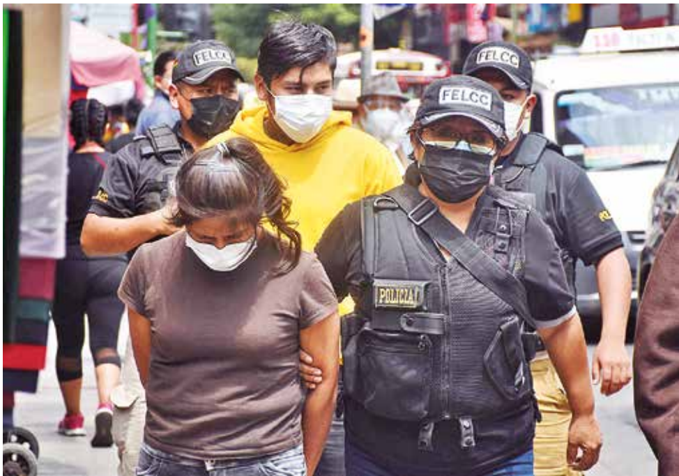
La madre y el padrastro del menor flagelado en la audiencia cautelar, ayer. JOSE ROCHA

El segundo caso se trata de una niña de un año y ocho