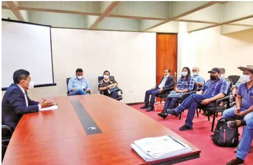
El ministro de Justicia, Iván Lima, en una de las cumbres para difundir su reforma.

“Es apresurado y es para la imagen, porque si hasta ahora no lo han hecho, ¿desde cuándo están Arce Catacora y el ministro Lima en el Gobierno? Y en ese lapso no han podido hacerlo o no quieren hacerlo, habrá más bien que plantear las cosas de esa manera”, dijo a ANF.