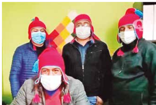
Los presuntos integrantes de “Wila Lluch’us”.

Violencia. Colectivos que defienden al partido de Gobierno como “Los Satucos” actúan con agresividad contra opositores