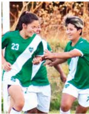
El club Exótico espera por rival en la final. SEMILLERO DE CAMPEONES

Wilstermann superó 3-1 a Vinto Palmaflor en el duelo semifinal del fútbol damas. No obstante, el cuadro de Quillacollo impugnó al Rojo por la mala actuación de una jugadora, ya que este plantel está impedido, desde FIFA, de poder habilitar futbolistas en todas sus categorías.