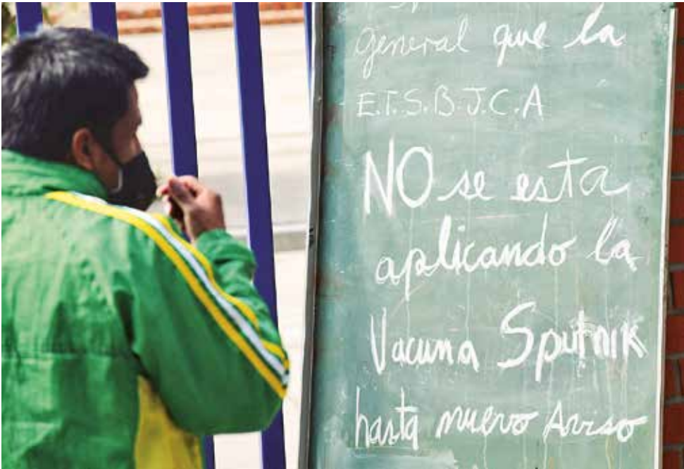
Un aviso que anuncia que se agotaron las segundas dosis de Sputnik V. CARLOS LÓPEZ

+ Aplicación de las dosis de Sputnik V A la fecha se vacunaron 189.781 personas con primeras dosis de la Sputnik V, pero sólo recibieron la segunda 57.272, dejando un saldo de 132.509 que espera el último componente, pero sin fecha.