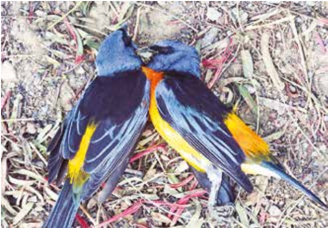
Aves muertas: Pipraeidea bonariensis (naranjero).

que abundan en esta zona. Vamos a seguir insistiendo para saber las causas. Lamentablemente, los productores andan fumigando todo el tiempo y tal vez usaron químicos fuertes”, sostuvo.