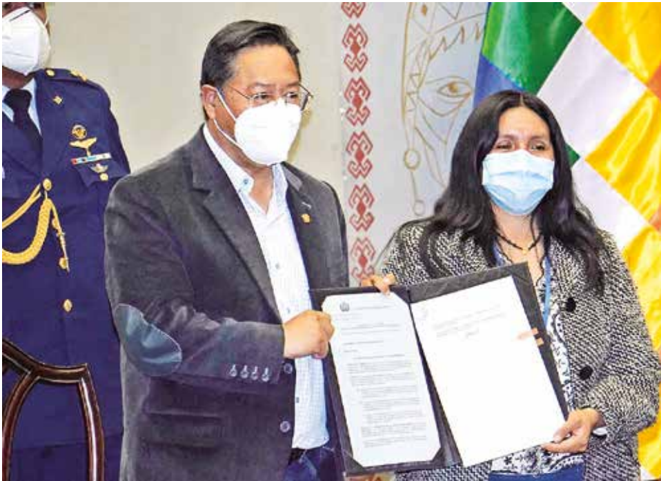
El presidente Luis Arce promulga la Ley de Devolución de Aportes.

“Esta decisión de retirar o no los aportes es absolutamente personal de cada uno de quienes han aportado al Sistema de Pensiones, cada uno evaluará la conveniencia o no del retiro, no es de ninguna manera obligatorio (...). Tengo que decirles en mi calidad de presidente del Estado Plurinacional, que lo piensen, que lo mediten profundamente, cuando uno necesita más necesita los recursos es cuando las fuerzas lo han abandonado”, dijo. La norma establece tres modalidades de devolución. La primera consiste en la entrega del 100 por ciento de los aportes a quienes cuenten con un ahorro menor o igual a 10 mil bolivianos y tengan más de 50 años de edad. La segunda modalidad consiste en la entrega del 15 por ciento de los aportes a quienes tengan hasta 100 mil bolivianos. La tercera modalidad está dirigida