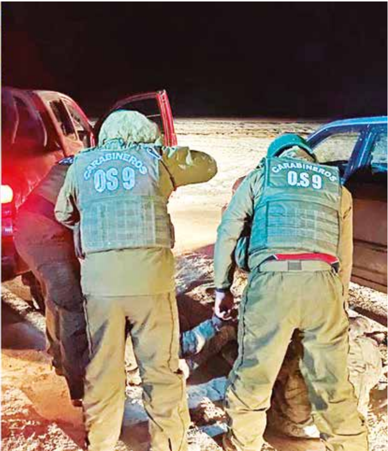
Los militares bolivianos detenidos en Chile, acusados de robar y disparar armas de guerra.