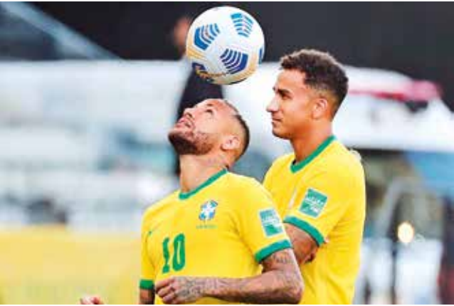
Neymar, referente de Brasil.

Fecha 10. La Canarinha tiene en sus manos la chance de ganar en casa y acercarse, con un partido a menos, a tocar la puerta de Catar