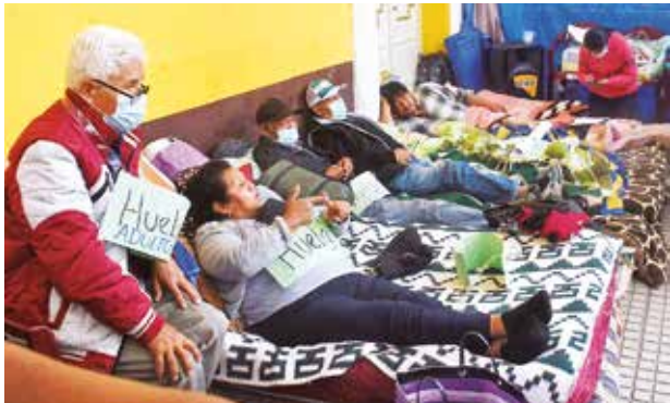
La huelga de los dirigentes de Huyallani. JOSE ROCHA

Costo. Las obras de ambas vías demandan una inversión de 28 millones de bolivianos, pero la Gobernación aún no tiene recursos