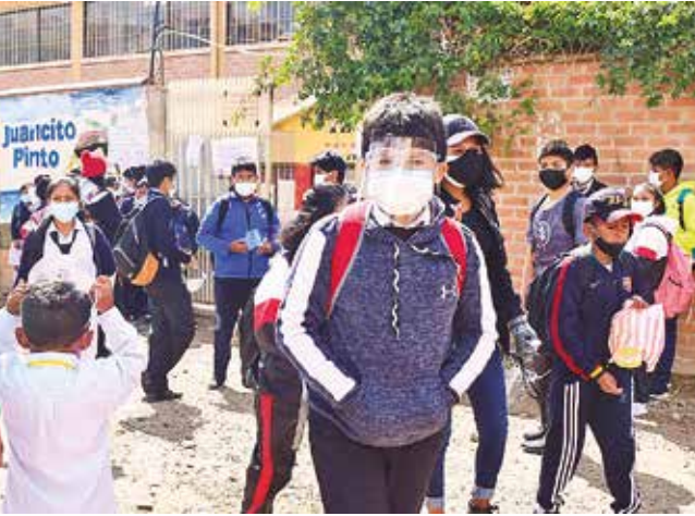
Niños ingresan a una escuela con bioseguridad. CARLOS LÓPEZ

Añadió: “Estamos ejecutando todos los mecanismos diplomáticos para que las vacunas lleguen al país”.