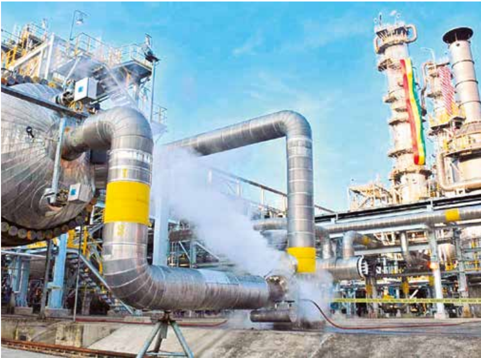
La fuga de gases en la planta de urea, ubicada en la localidad de Bulu Bulu.

“El precio será competitivo en el mercado interno y va a evitar que entre al país urea de contrabando, pero tampoco tendrá un costo que haga que terceros puedan llevar la urea al exterior de forma ilegal. Maximizaremos las utilidades”, indicó Zelaya.