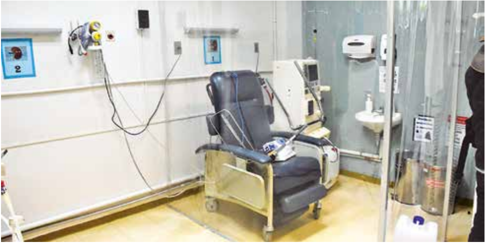
El área Covid-19 que habilitó el hospital materno. JOSÉ ROCHA

Las deficiencias que presenta el hospital del niño son falta de personal médico, porque no se dio ni un solo ítem en 2020 y falta de infraestructura, porque se dispuso 10 camas de cirugía para el área Covid-19 dejando con solo 26 camas a esa sección.