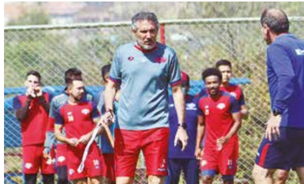
DT Cagna en entrenamiento de Wilstermann. CARLOS LÓPEZ