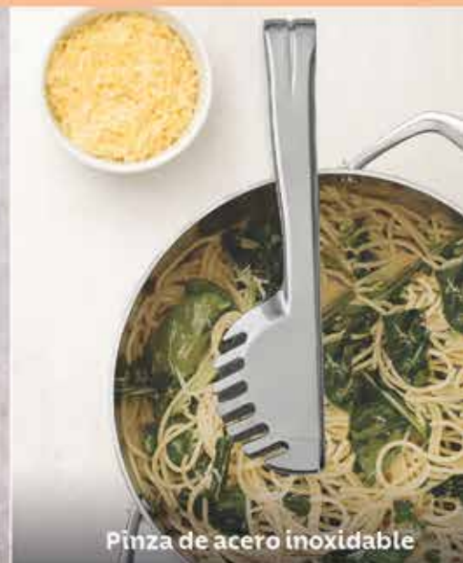
Pinza de acero inoxidable