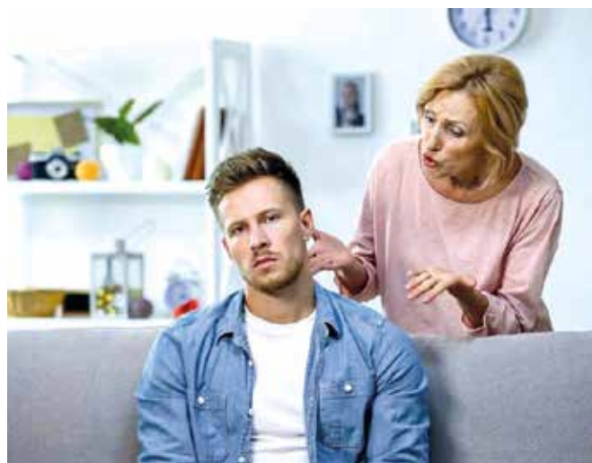
Características. Intenta controlar la vida de sus hijos y se victimiza.

Eliminar a las personas tóxicas puede parecer imposible, especialmente si se trata de la propia madre. Sin embargo, el daño emocional y psicológico causado por una madre tóxica durante su niñez suele ser devastador.