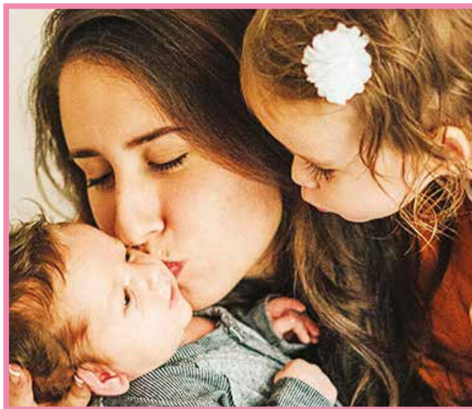
Amor. Las madres cumplen un rol importante en las familias.

La celebración del Día de la Madre varía de acuerdo a las costumbres de cada país, pero en la mayoría se celebra el mes de mayo.