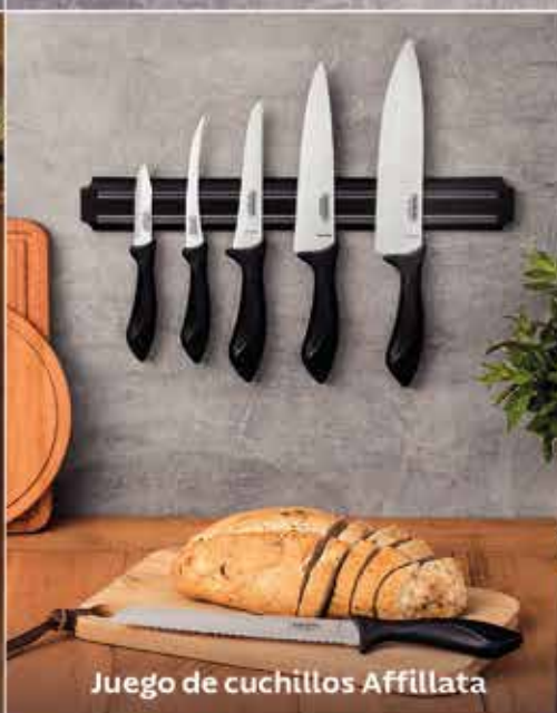
Juego de cuchillos Affillata