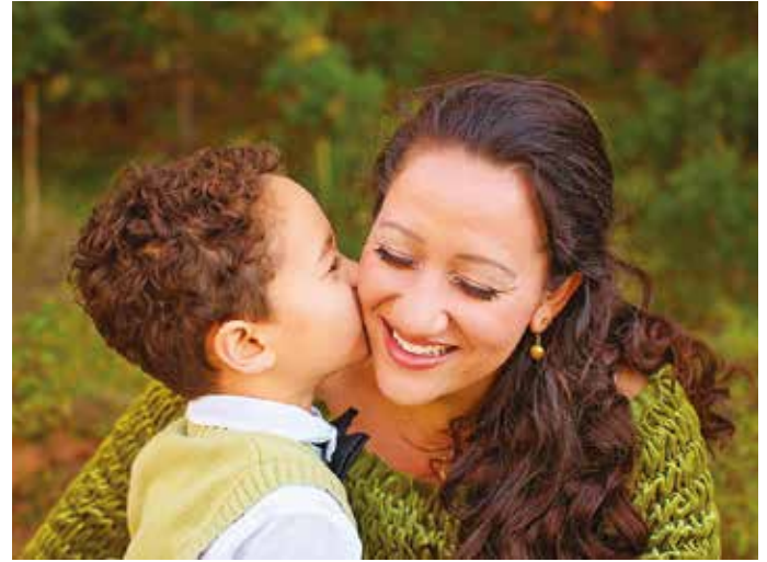
Dedicación. Las madres brindan amor y apoyo incondicional a sus hijos.

En Bolivia, la fecha fue establecida en honor a las Heroínas de la Coronilla, que