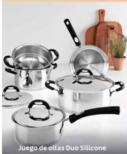
Juego de ollas Duo Silicone