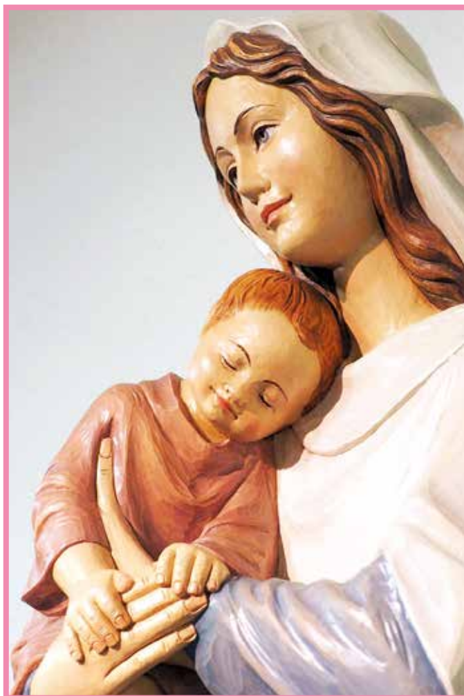
Historia. En países católicos, la madre queda representada por la figura de la Virgen María.