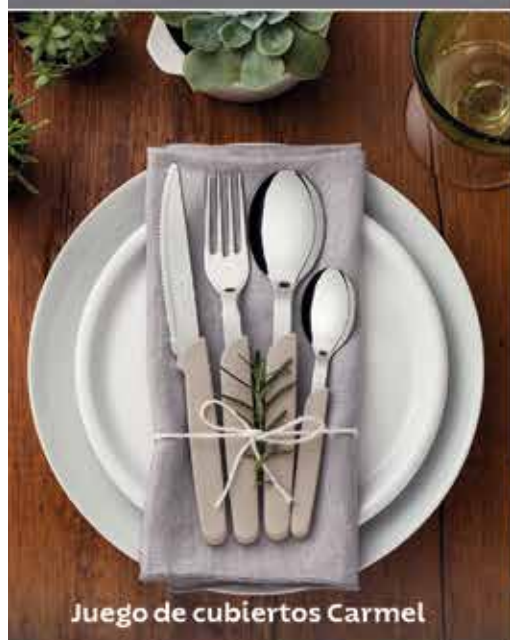
Juego de cubiertos Carmel