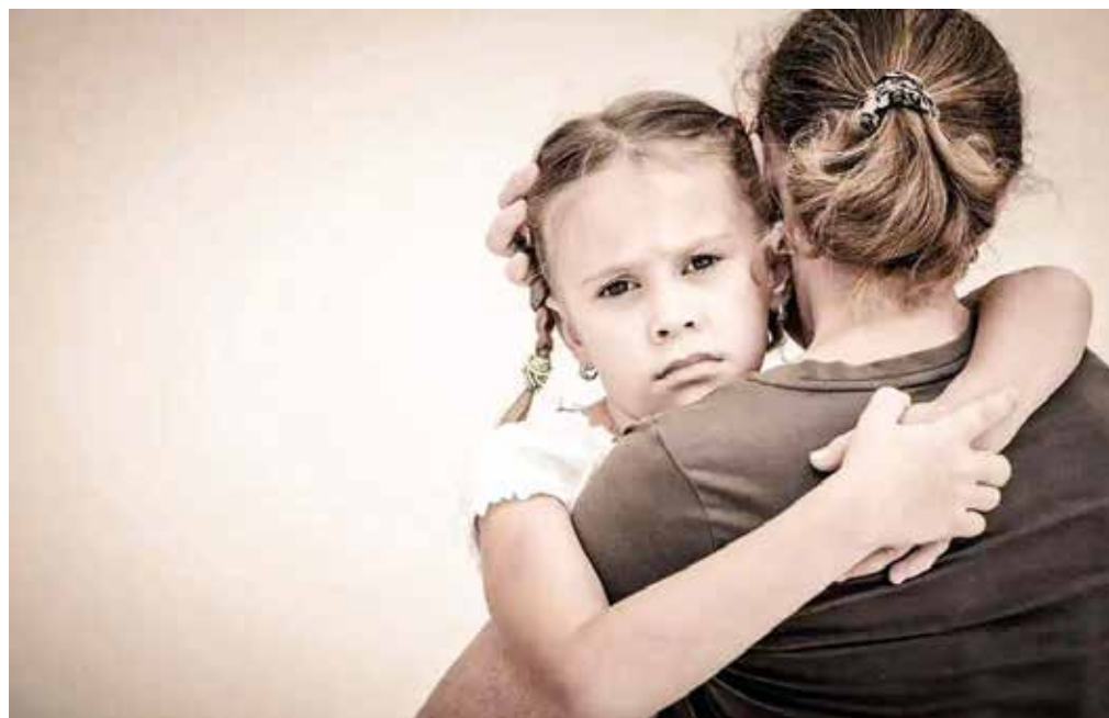
Crianza. Una madre tóxica causa daños en el desarrollo del niño.

mitirte “crecer” a sus hijos, siempre tiene que tener razón, se enfada con el hijo por mostrar sus emociones, minimiza los logros de sus hijos, hace críticas constantemente, ignora los problemas de sus hijos, usan la culpa y el dinero para controlar, hace responsable de su felicidad a sus hijos.