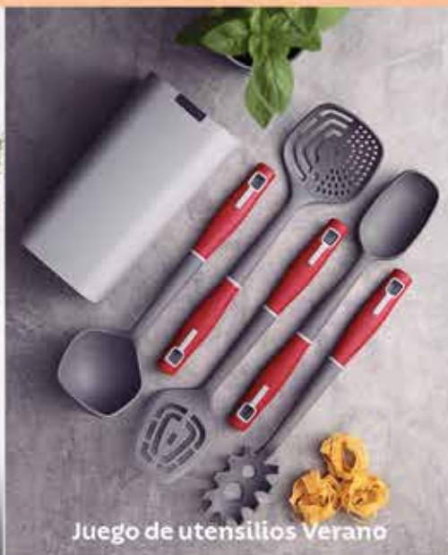
Juego de utensilios Verano