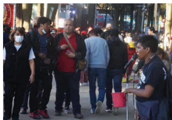
Afluencia dentro el campo ferial.