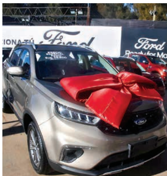
La imponente vagoneta Ford Territory. AXZXZ