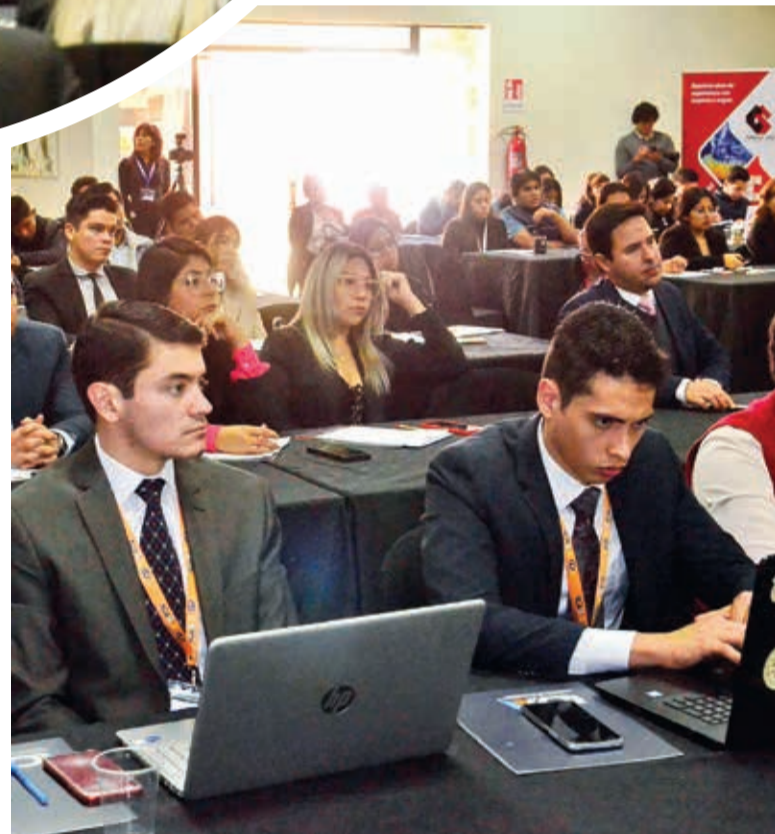
Desarrollo de la conferencia.