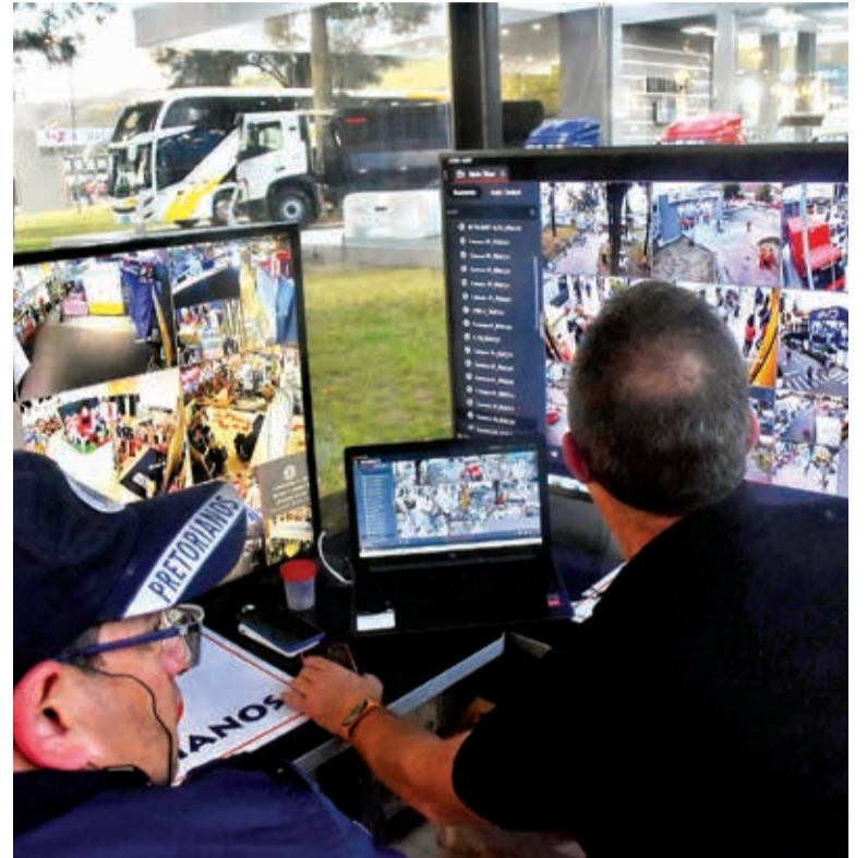
Centro de Monitoreo e Informaciones en la Fexco 2023. AXZXZ

Benvides resaltó que también se dispone de tres ambulancias en la feria para cualquier eventualidad.