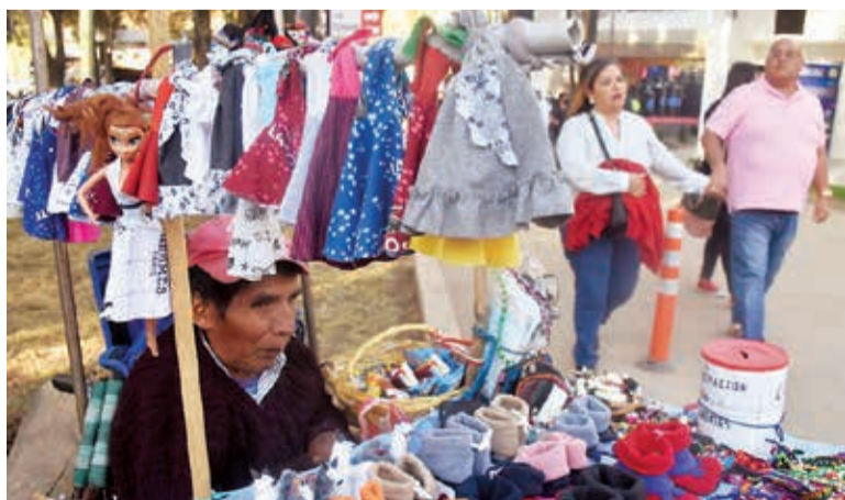
Venta de ropitas para muñecas y otros accesorios.