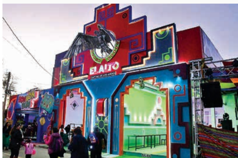
Frontis de un cholet en la Fexco 2023. CARLOS LÓPEZ