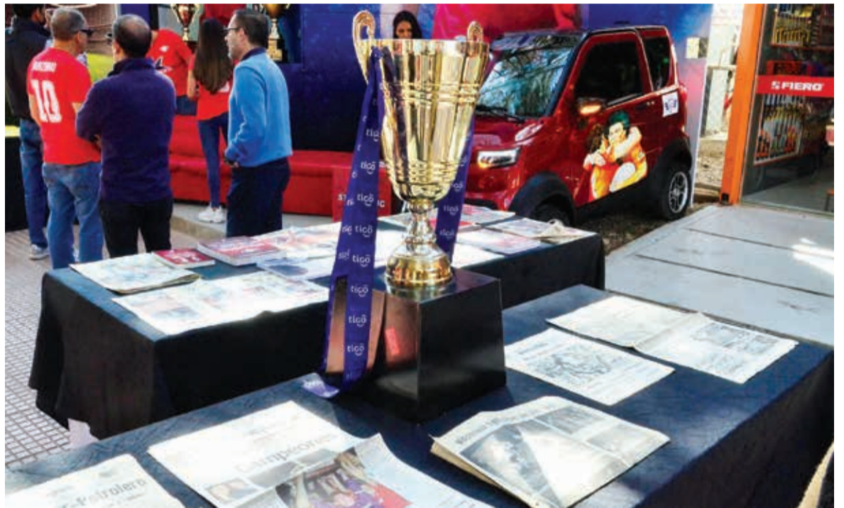
Publicaciones sobre Wilstermann. HERNÁN ANDÍA