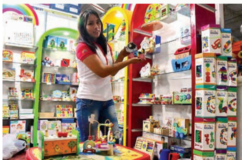
Juegos didácticos para niños menores de dos años. CARLOS LÓPEZ

También se promocionan las actividades a favor del medio ambiente, de la salud y la prevención de la violencia.