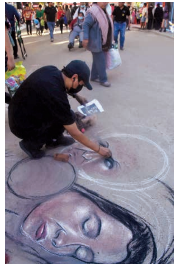
Artistas dibujan en los exteriores.