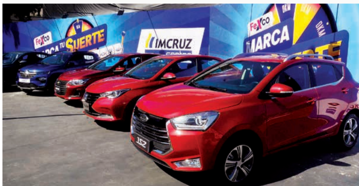
Los autos que el ganador puede elegir. HERNAN ANDIA