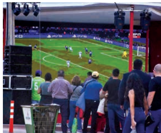
Visitantes observan la final de la Champions.