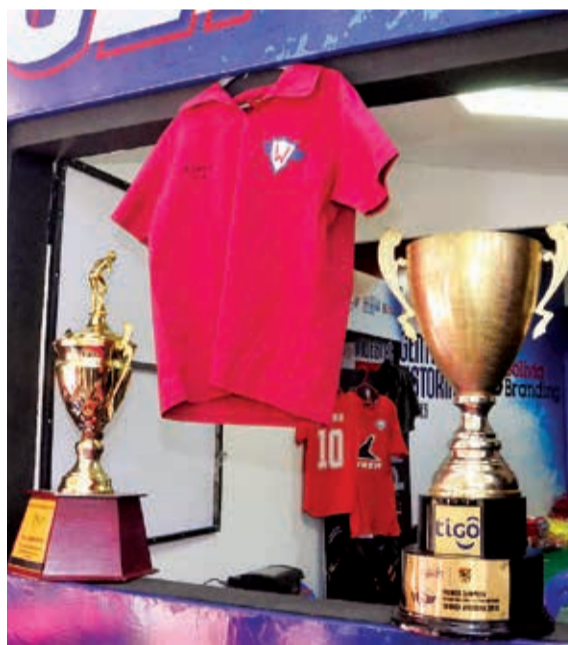
Trofeo de Wilstermann. HERNÁN ANDÍA