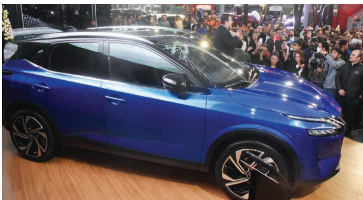
Taiyo Motors presenta la nueva Nissan Qashqai. JOSE ROCHA