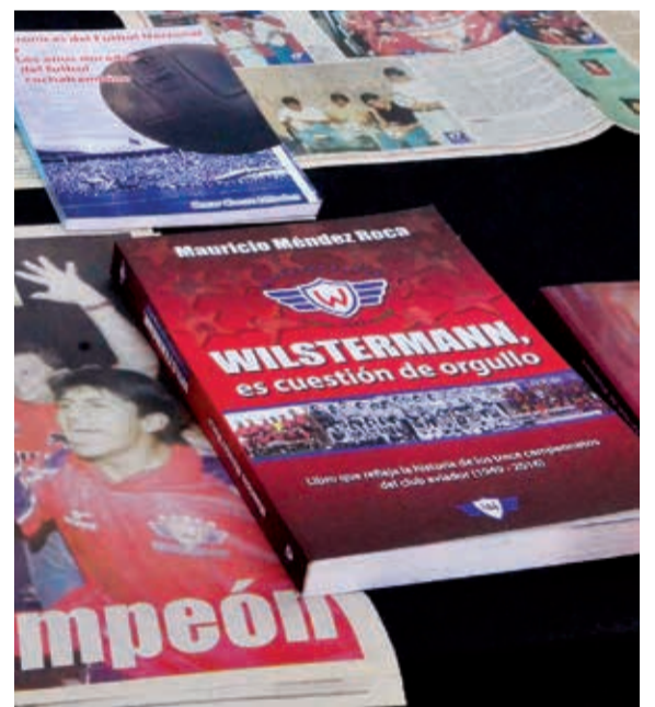
Ediciones de Los Tiempos. HERNÁN ANDÍA