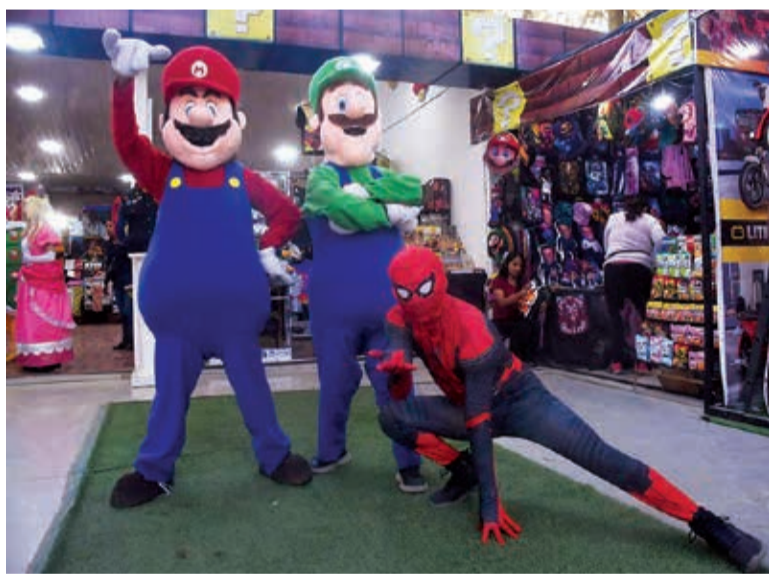
Mario Bros y el Hombre Araña en Expo Friki.