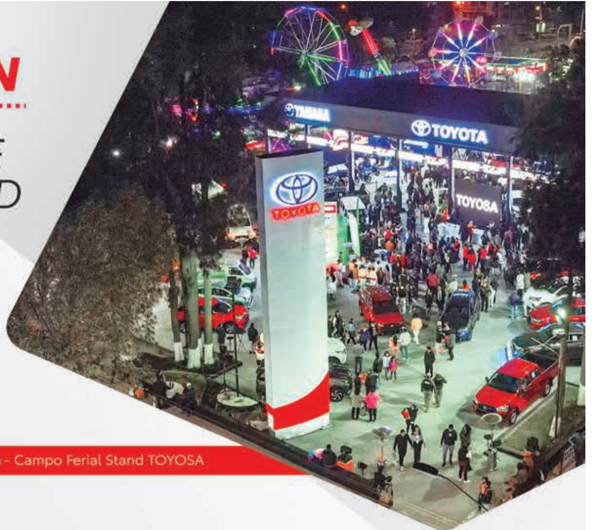
Vista aérea - Campo Ferial Stand TOYOSA