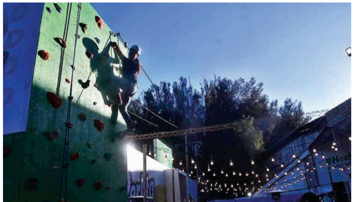
Una visitante escala un muro en el stand de la empresa Perlita.