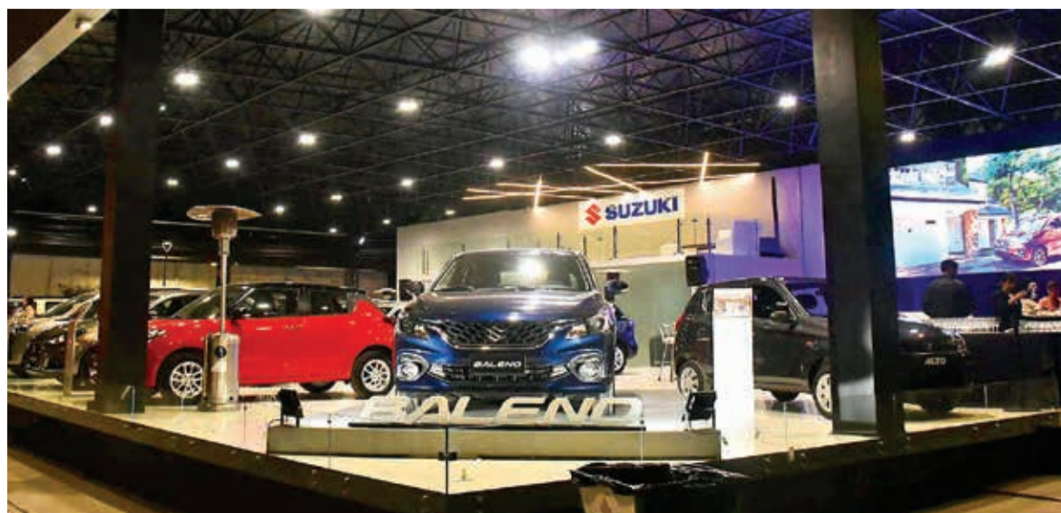
Imcruz exhibe su stand renovado. CARLOS LÓPEZ