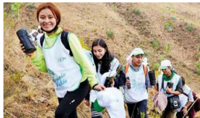
Labores de forestación impulsadas por CBN. RRSS

Las actividades de RSE están enfocadas a la comunidad, trabajadores, clientes o consumidores y proveedores.