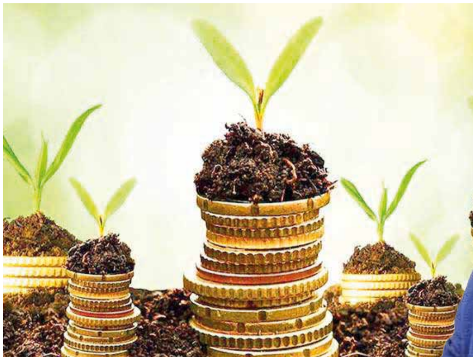
Las empresas amigables con el medioambiente obtienen mejor reputación.

Desarrollo. Cada vez más empresas bolivianas aplican actividades de Responsabilidad Social Empresarial