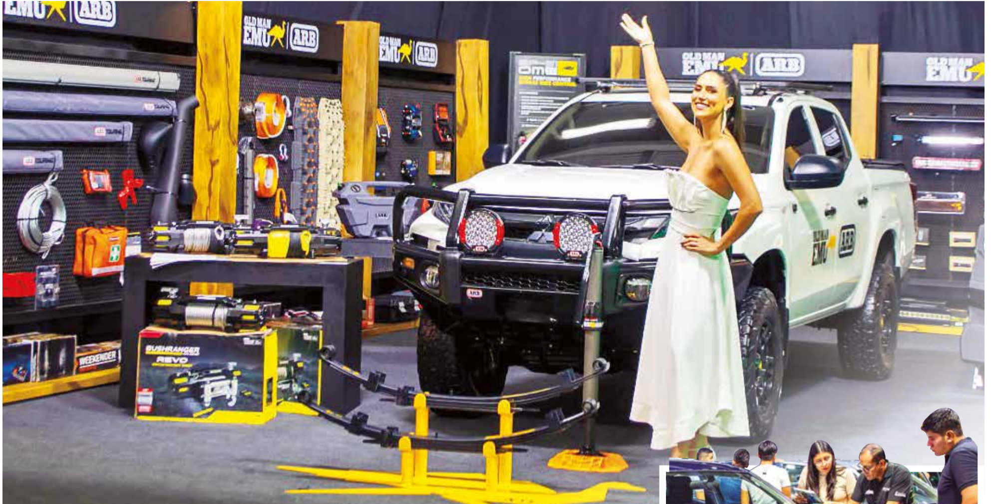
Un vehículo y autopartes en Expoauto.