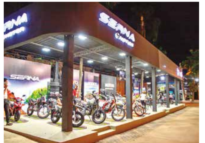
Motocicletas en exhibición.