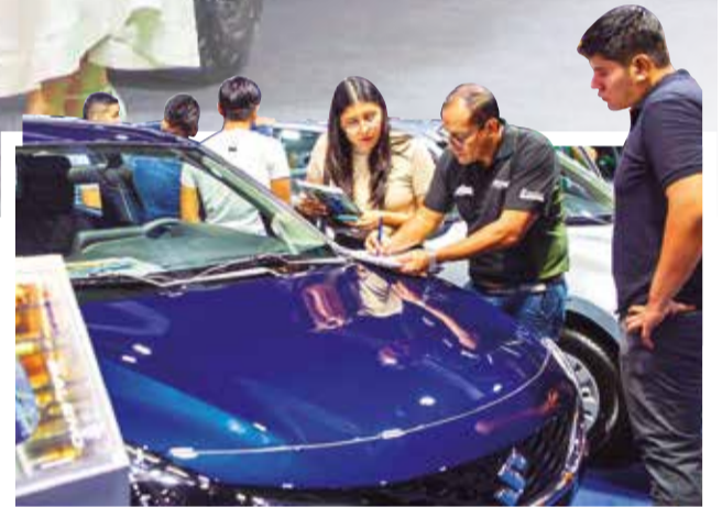
Asistentes en Expoauto.