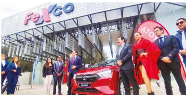
Presentación de los motorizados que serán sorteados en la feria. D. J.

También explicó que, al ingresar al recinto, las personas que hayan com-