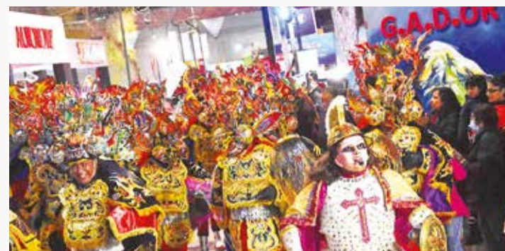
La diablada orureña durante su visita en 2023.