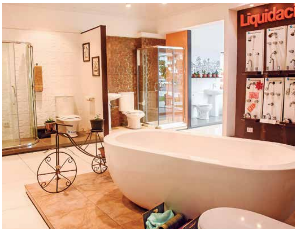
MATERIAL Grifos, baños clásicos con su toque moderno, son algunos de los productos que ofrece Campero.

apoyaba todo lo que podía. Su interés era tal que en cuanto salió bachiller decidió dedicarse en la totalidad de su tiempo a esta tienda. Hoy es la gerente general de la Importadora Campero”, agregó Paravicini.