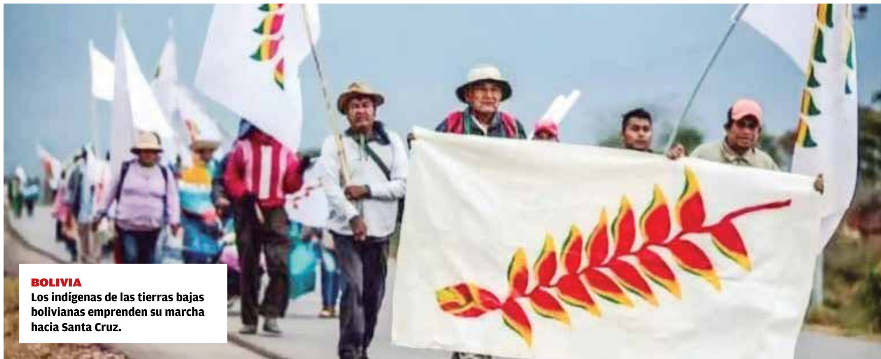
BOLIVIA Los indígenas de las tierras bajas bolivianas emprenden su marcha hacia Santa Cruz.