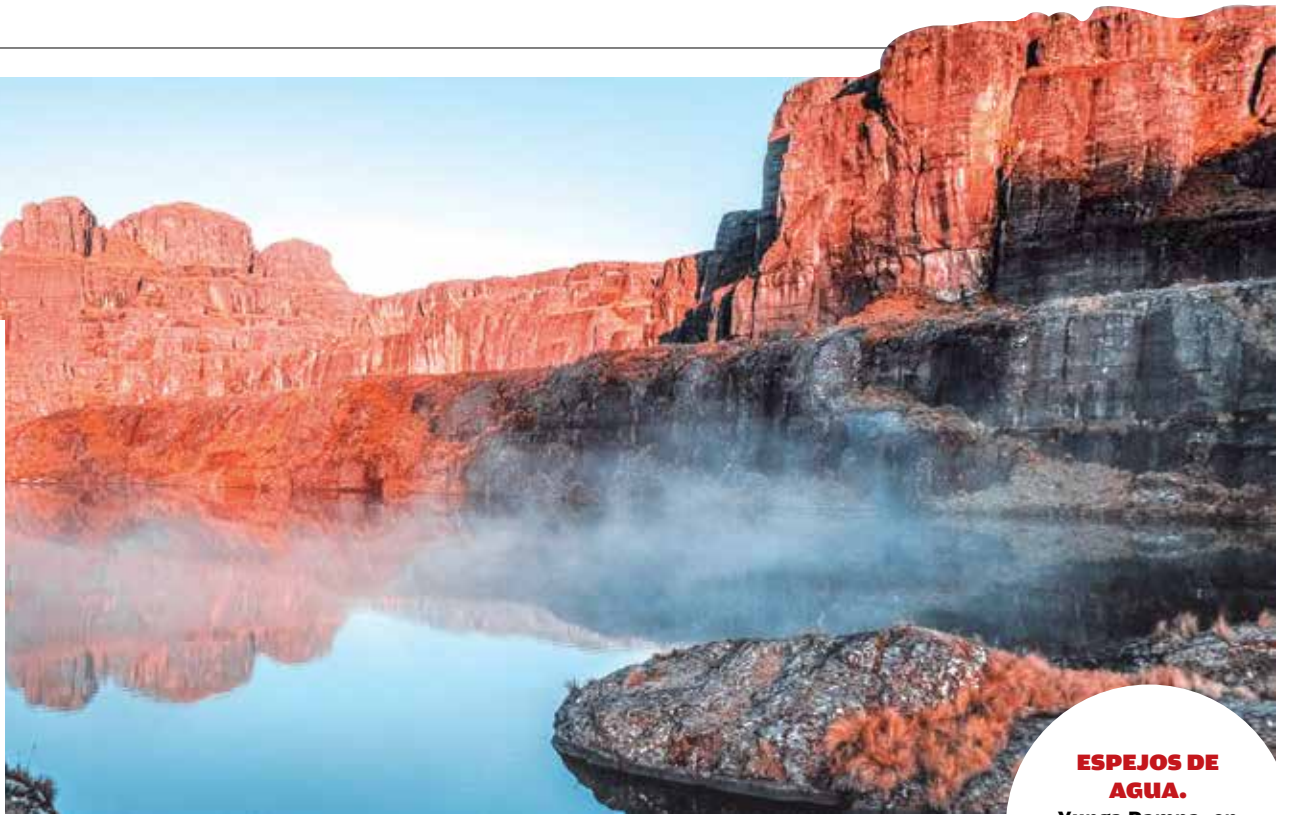
ESPEJOS DE AGUA. Yunga Pampa, en Cochabamba, esconde hermosas y cristalinas lagunas.

Entendemos, hoy más que nunca, que somos parte de Bolivia, Una Gran Nación.