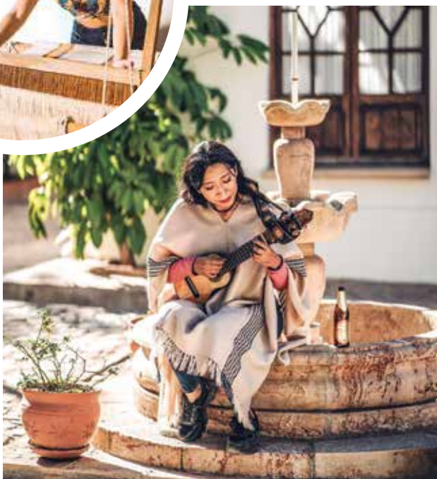
CULTURA. La capital boliviana, Sucre, irradia cultura en cada paso que se da por la ciudad blanca.