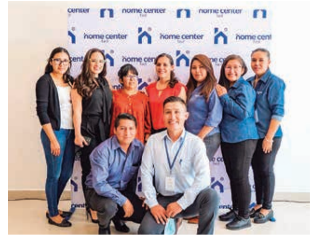
Reunidos. Equipo de compras, visual y supervisores de la tienda.