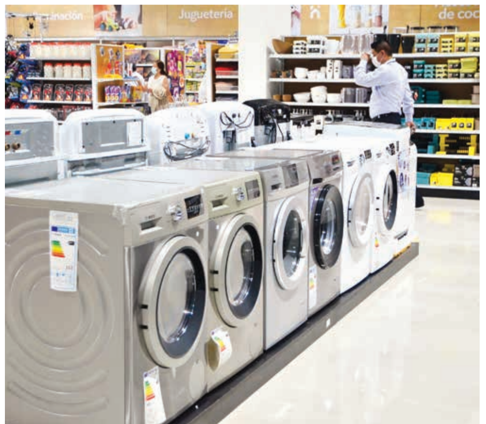
Variedad. Distintas marcas y modelos en electrodomésticos destacan en la sucursal. HERNÁN ANDÍA

Ventas corporativas. ¿Tiene una empresa, negocio o busca comprar por volumen?, la empresa cuenta con especialistas en ventas corporativas que le guiarán para encontrar lo que necesita al mejor precio.