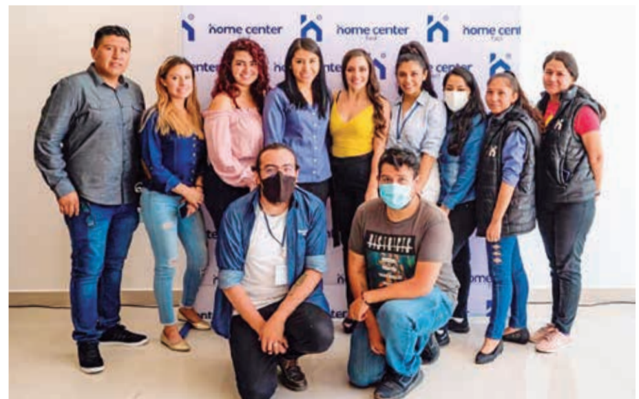
Alegría. El equipo de trabajo del área de marketing y ecommerce.