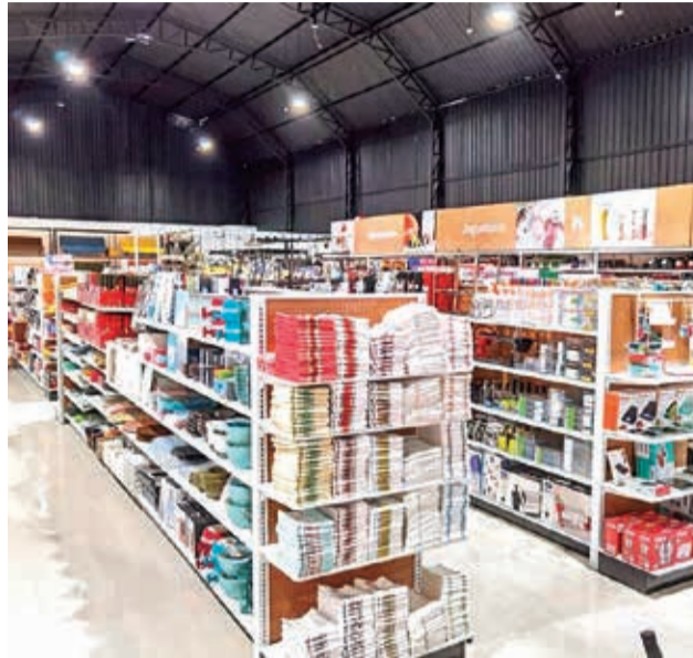
Nueva sucursal. Las instalaciones cuentan con amplios y cómodos ambientes. HERNÁN ANDÍA

Valores. Es una empresa guiada por sus valores, los cuales constituyen los principios y prioridades sobre las cuales se conforma la empresa y además trazan el camino que les permite llevar adelante su misión y visión.