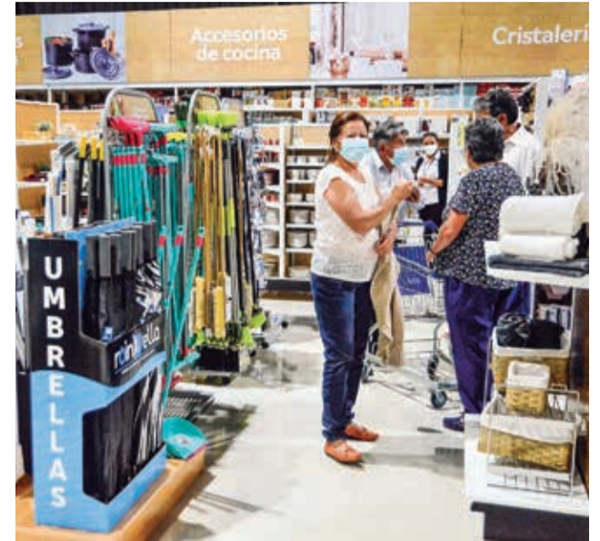
Hogar. La nueva multitienda, en la zona oeste, cuenta con una variedad de productos. HERNÁN ANDÍA