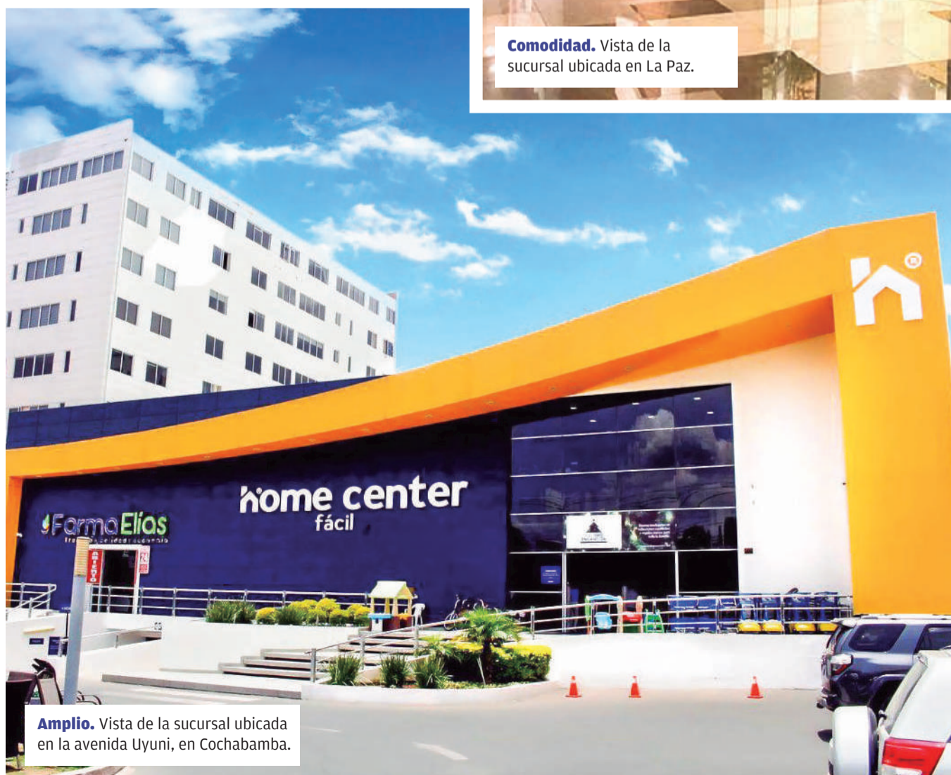
Amplio. Vista de la sucursal ubicada en la avenida Uyuni, en Cochabamba.