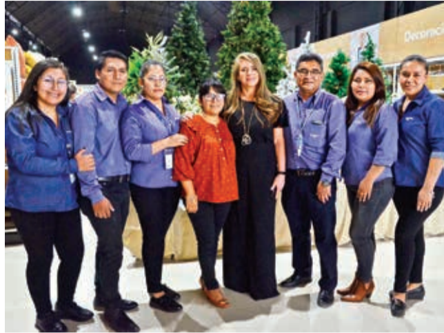
Respaldo. Parte del equipo de administración de Home Center Fácil.

Se trata de la segunda sucursal en el departamento y está ubicada en la avenida Beijing, entre Luis Montañó Milan y Chimane (una cuadra y media antes de llegar a la av. Tadeo Haenke).