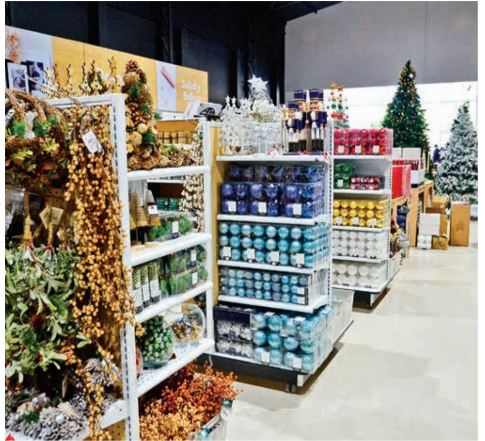
Celebración. Los artículos con motivos navideños por las fiestas de fin de año en la multitienda. H. ANDÍA