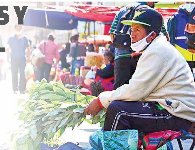
MERCADO. La venta de plantas medicinales en La Cancha.