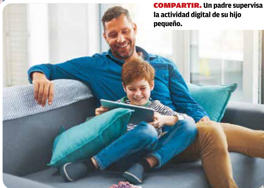
COMPARTIR. Un padre supervisa la actividad digital de su hijo pequeño.