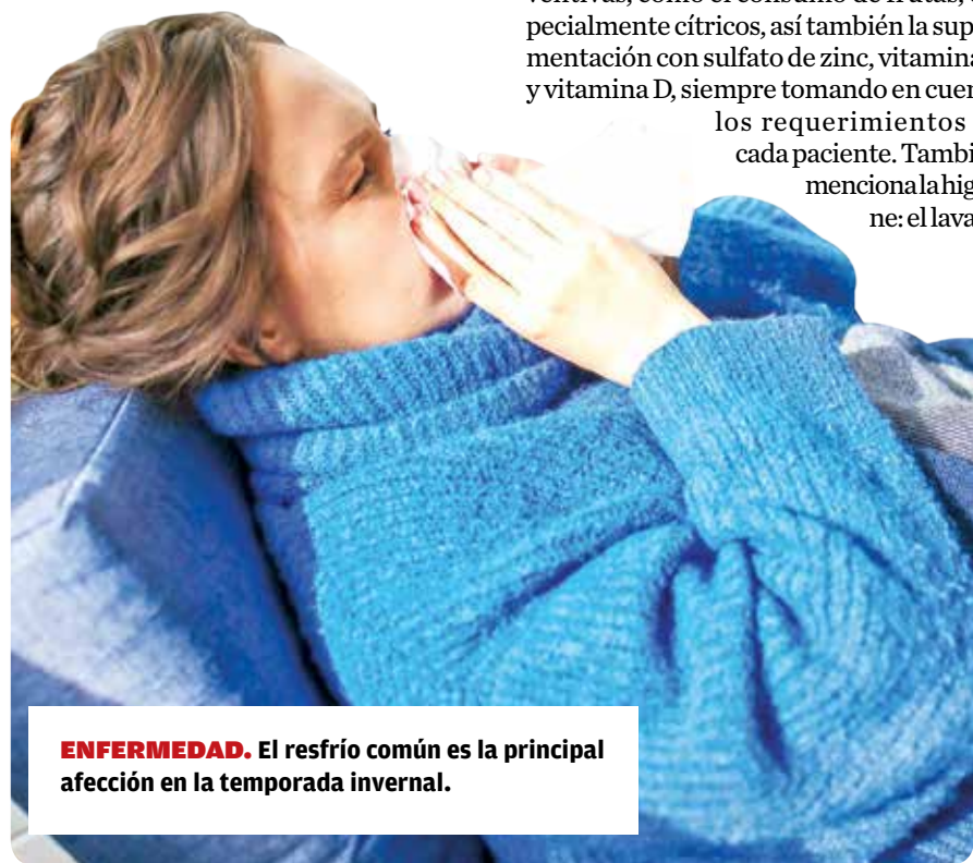
ENFERMEDAD. El resfrío común es la principal afección en la temporada invernal.

Los riesgos de ambos procedimientos están en la sobredosificación, tanto en medicina farmacológica como en la medicina tradicional, así también los efectos colaterales que pueden existir, ya que se puede dar una combinación de plantas o medicamentos inadecuada que puede provocar efectos adversos. Es por esa razón que el especialista sugiere que se debe tener la evaluación de un médico antes de consumir una dosis anticipada.