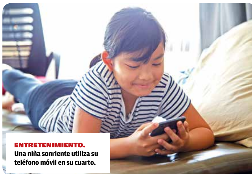
ENTRETENIMIENTO. Una niña sonriente utiliza su teléfono móvil en su cuarto.

"Los datos indican que prácticamente uno de cada cinco menores ha recibido solicitudes sexuales a través de internet, tanto de personas adultas como de otros menores. Además, dos de cada tres menores que practican 'sexteo' (intercambio de imágenes íntimas) lo hace bajo