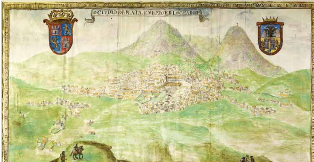
ANTIGUO. Plano de la Villa de La Plata de Pedro Ramirez del Aguila, 1639.