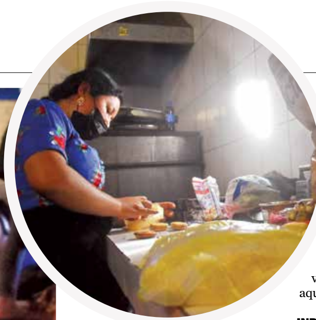
REPOSTERÍA. Una interna prepara empanadas.

salen de la cárcel a las 8:00 al hogar Tía Shirley, donde estudian y reciben desayuno y almuerzo. A las 16:00 ellos retornan al recinto. Ése era el caso de sus hijos hasta que cumplieron los seis años.