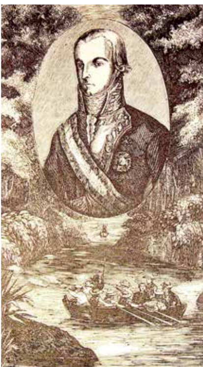
RETRATO. Ramón García de León, el primer marqués de la Casa de Pizarro. Grabado de 1852.