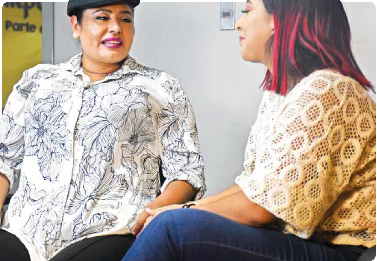
ENTREVISTA. Coral cuenta sus experiencias y vivencias como chef.

- Hay un antes y hay un después de Coral. Un antes, cuando de repente estaba como parte de los cocineros clásicos y un cambio de chip cuando estuve en Dinamarca, donde principalmente aprendí a respetar nuestros productos. Recuerdo estar haciendo un plato cochabambino, el pique macho, y había pedido una papa holandesa, porque la papa frita se hace con la papa holandesa acá, entonces, pedía, y cuando vi unas papitas así, superchiquititas, y digo se han equivocado de papa, yo pedí papa holandesa, y además estando en Dinamarca, Holanda estaba ahí cerca, yo