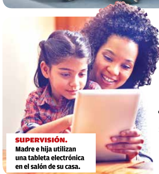
SUPERVISIÓN. Madre e hija utilizan una tableta electrónica en el salón de su casa.

través de las redes sociales", explica Irene Montiel, profesora de Criminología y del máster universitario de Ciberdelincuencia de la Universitat Oberta de Catalunya (UOC), experta en el estudio de la captación de menores a través de internet.