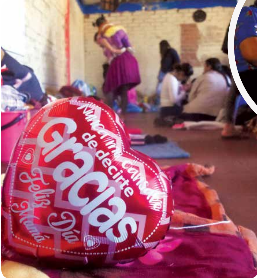
HACINAMIENTO. El área donde duermen las reclusas que recién ingresaron al penal.