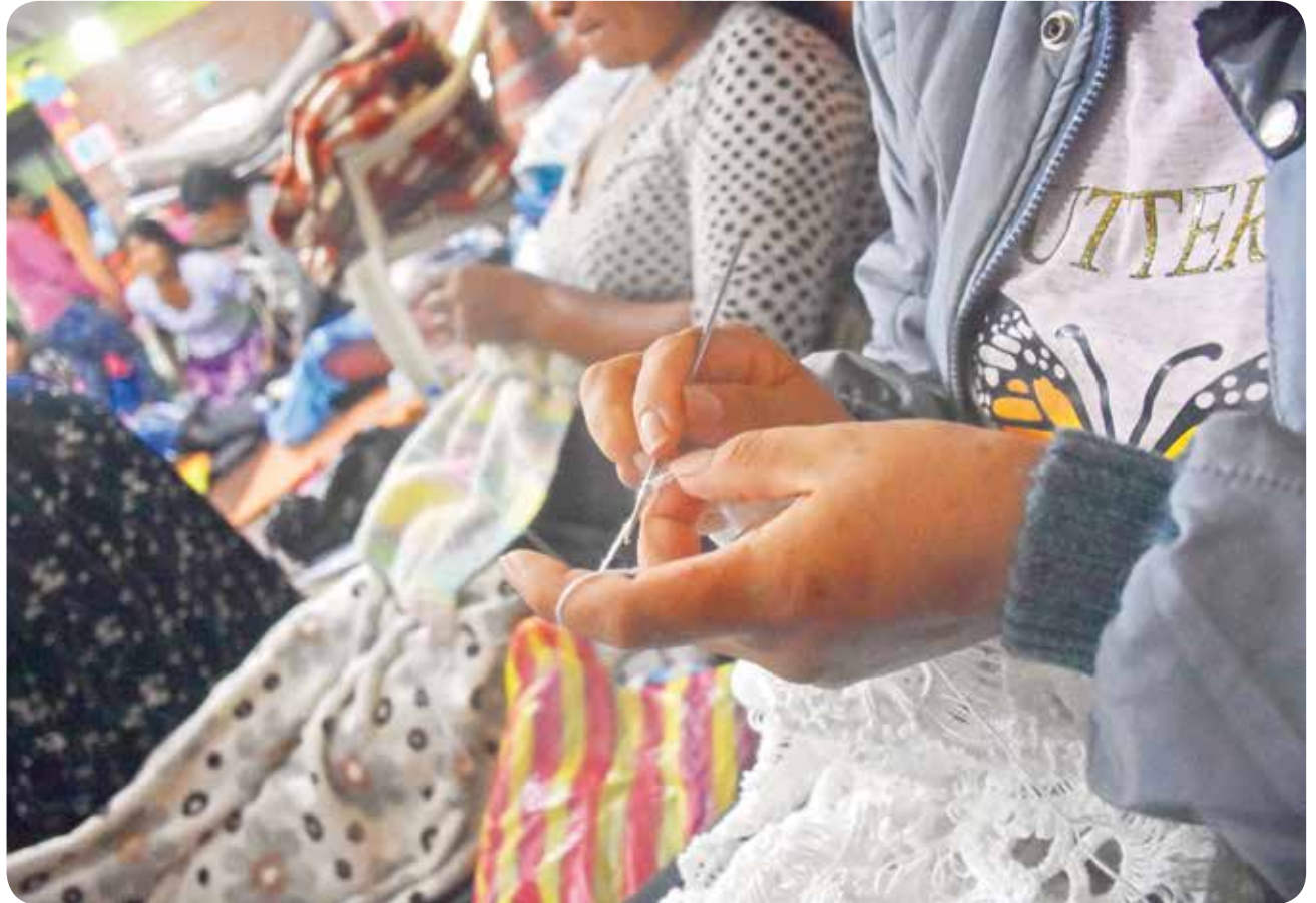
MANUALIDADES. Un grupo de mujeres realiza prendas tejidas.

La funcionaria señala que estas condiciones no son adecuadas para los niños, pero aun así muchas madres prefieren tener a sus hijos con ellas, antes de dejarlos con familiares o en hogares. “La Defensoría de la Niñez y la Defensoría del