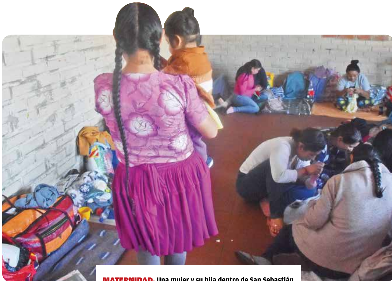
MATERNIDAD. Una mujer y su hija dentro de San Sebastián (arriba). Abajo, una reclusa en un ambiente improvisado como dormitorio y otra lee la biblia.